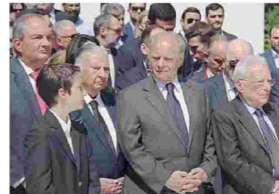
«Ζουμ» σε μια οικογενειακή Ν.Δ. φωτο: Κώστας Αλ. Καραμανλής, Αλέξανδρος Κ. Καραμανλής, Αχιλλέας Γ. Καραμανλής και οι Γιάννης Βαρβιτσιώτης και πρόεδρος Πέτρος Μολυβιάτης, επικεφαλής της «Παλαιάς Φρουράς» που παραμένει μαχητική....