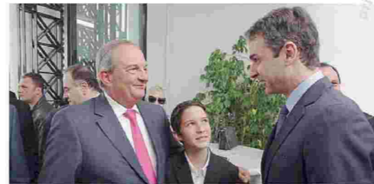
Είδηση είναι η παρουσία του 13χρονου Αλέξανδρου Κ. Καραμανλή στο πλευρό του πατέρα του, πρώην πρωθυπουργού κ. Κώστα Αλ. Καραμανλή, για το Μνημόσυνο του αδελφού του παππού του, Αλέκου Καραμανλή. Γνωριμία με τον πρόεδρο της Ν.Δ. κ. Κυριάκο Κ. Μπτσοτάκη.