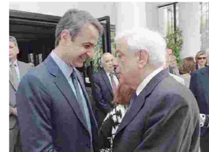
Ο Πρόεδρος της Δημοκρατίας κ. Προκόπης Παυλόπουλος σε θερμή χειραψία και συνομιλία με τον πρόεδρο της Ν.Δ. κ. Κυριάκο Μπτσοτάκη.