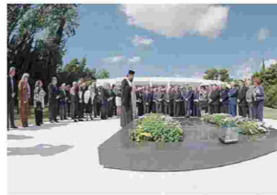
Το Μνημόσυνο του ιδρυτού της Νέας Δημοκρατίας Κωνσταντίνου Γ. Καραμανλή τέλεσε, για τη 18η επέτειο του θανάτου του, το Ίδρυμα στη Φιλοθέη, όπου η πλάκα του τάφου αντικατοπτρίζει το σύννεφο που παρακολουθεί... (25/4/2016)

Χθες, όμως, Μεγάλη Δευτέρα 25 Απριλίου 2016, αρχή της εβδομάδας των Παθών, με τον σταυρικό θάνατο του Ιησού Χριστού που ακολουθεί η Ανάσταση, πέρασε ένα μήνυμα εγρήγορσης σε αυτούς που κύκλωσαν με συγκίνηση το μνήμα του, με πρωτοστάτη τον αδελφό του εκλιπόντος προέδρου, τον υπουργό κ. Αχιλλέα Γ. Καραμανλή, αντιπρόεδρο του Ίδρυματος Κ. Γ. Καραμανλή. «Σε στενό κύκλο συγγενών και φίλων το Μνημόσυνο» ήταν η τηλεφωνική πρόσκληση από τη γνώριμη φωνή, με την παράκληση «να μη δοθεί δημοσιότητα». Λόγω απεργίας δεν υπήρχαν εφημερίδες, ραδιόφωνο, τηλεόραση, Διαδίκτυο για να τιμηθεί η 18η επέτειος του θανάτου του Προέδρου Κωνσταντίνου Καραμανλή (1907-1998), του Εθνάρχη, για τους πιστούς της «Παλαιάς Φρουράς» που και αυτή τη φορά ήταν η πλειοψηφία. Και ήταν αυτοί που χάρηκαν για την είδηση, ότι «ο στενός κύκλος» περιελάμβανε τον Πρόεδρο της Δημοκρατίας κ. Προκόπιο Παυλόπουλο και τον πρόεδρο της Νέας Δημοκρατίας, τον νέο και δυναμικό αρχηγό της αντιπολίτευσης στη Βουλή, τον κ. Κυριάκο Κων. Μπ